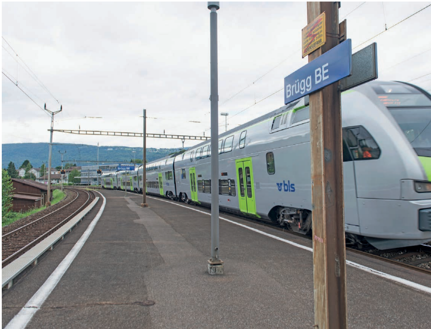
SBB, BLS und RBS bauen ihr Bahn-Angebot auch im Seeland aus.

Die Bahnlinie S31, die meistens nur zwischen Belp und Münchenbuchsee verkehrt, wird zur Hauptverkehrszeit vermehrt bis nach Biel weitergeführt. Das ergibt täglich zwei zusätzliche Ver-